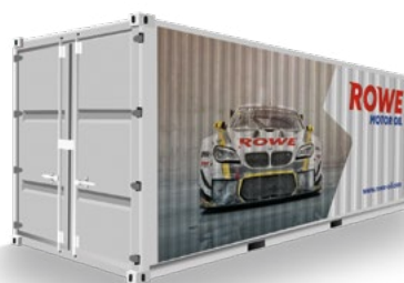
Container-Verschiffung / Container Shipments