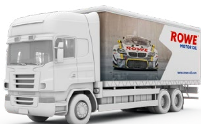
LKW-Transport / Truck Shipments

*2-lagig stapelbar./Stackable in 2 layers.